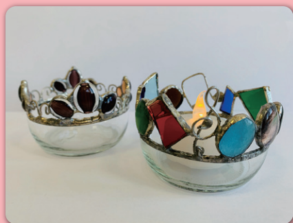
キャンドルホルダー

鏡や板ガラス、色ガラスなどを、はんだ付けでしっかり固定し、スタンドミラーを作ります。