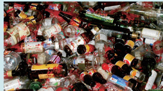
↑ 赤色の塗料が入ったビンが割れ、まわりのビンにも付着しています。塗料のついたビンはリサイクルできず、埋立処分になりました。

クリーンプラザおとくにに搬入されたカンやビンなどの資源ごみは、手選別を行ったのち、資源化(リサイクル)されています。しかし、中にはペンキ・塗料や接着剤が入ったままのカンやビンが入ってくる場合があります。これらは、運搬中または処理中に他の資源ごみに付着することでリサイクルすることができず埋立処分となってしまう。さらには、塗料などは処理施設の設備や機械の故障の原因となることもあります。塗料などが余った際は、いらない紙や布に塗りつけるなどして必ず使い切り、紙や布は乾かしてから燃えるごみへ、空となった容器はその他不燃物として出してください。