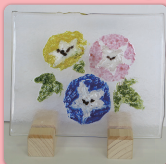
サマー／ハロウィン／クリスマスプレート

乙訓環境衛生組合は、向日市、長岡京市及び大山崎町の2市1町が環境行政の一部を共同して行うことを目的として設立されている一部事務組合(特別地方公共団体)です。