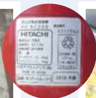
リサイクルマーク