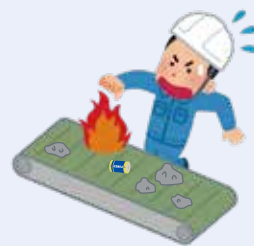
破砕処理中に発火した製品

ガスが残った状態のスプレー缶や電池類が入ったまま収集されると収集車や施設内で発火するおそれがあり、火災が発生することもあります。