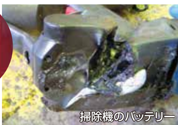
掃除機のバッテリー