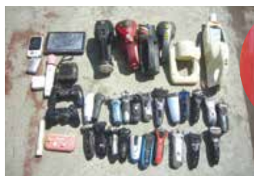
電池類が入ったまま出された製品