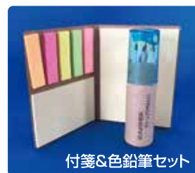
付箋&色鉛筆セット

ごみを分別するときのちょっとした工夫や、食品ロスを減らすための買い物や料理の仕方など、みなさんが日々の暮らしのなかで実践されている「あなたのSDGs」を教えてください。応募された内容は、今後発行の「広報クリーンプラザおとくに」に掲載する予定です。抽選で10名様に粗品をプレゼントします。